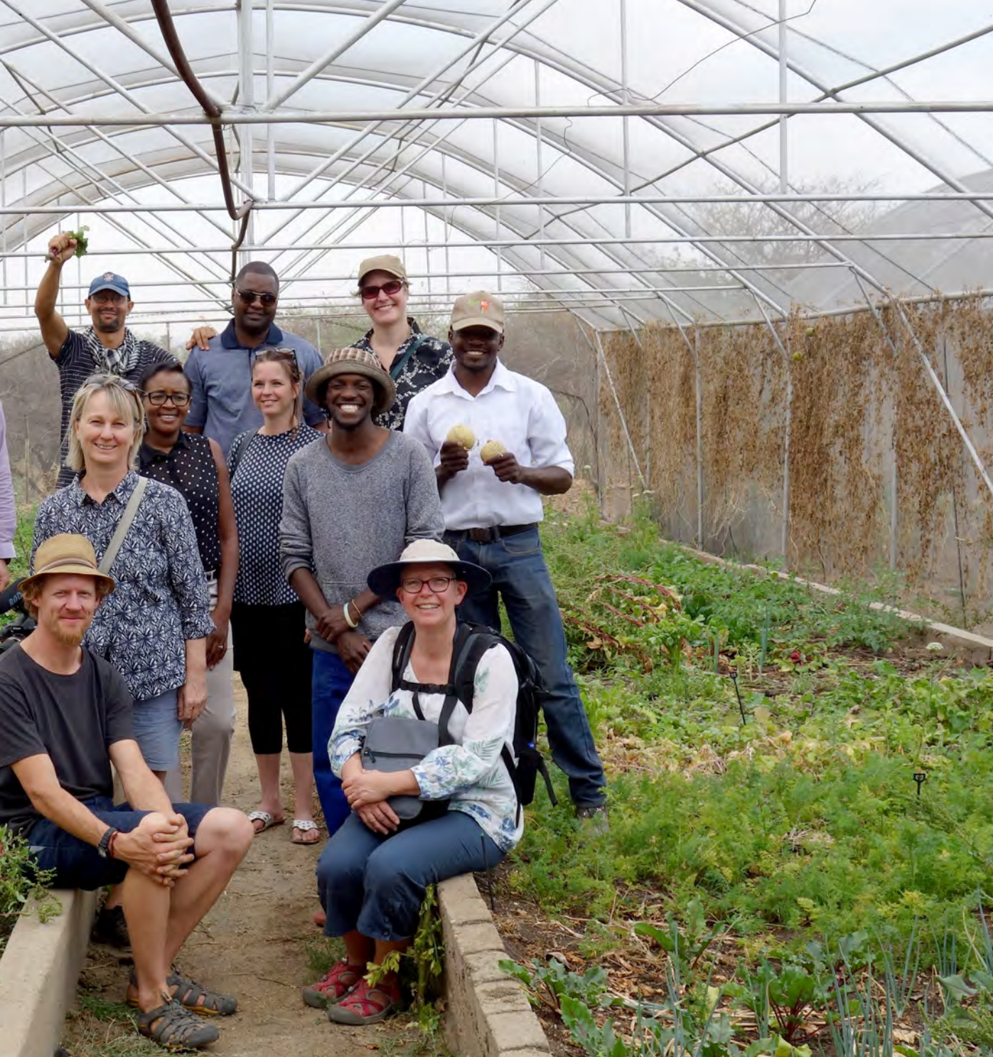
Deltagare i det kommunala partnerskapet mellan Malmö och Swakopmund i Namibia skördar resultat från projektet "Awareness III Urban Gardening".