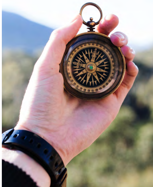
Att följa upp genomförandet av Agenda 2030 är viktigt.

– ATT FÖRÄNDRA VÅR VÄRLD: AGENDA 2030 FÖR HÅLLBAR UTVECKLING