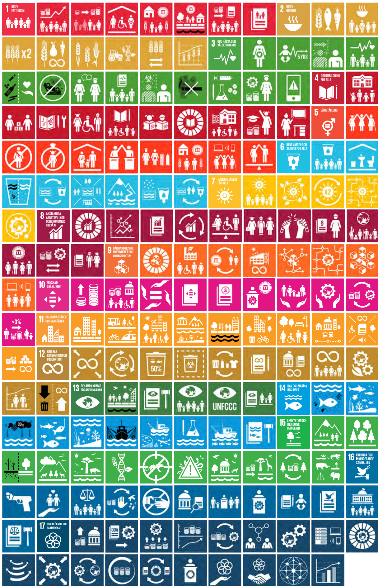
Ikoner för de 17 globala målen och de 169 delmålen är framtagna av Trollbäck+company.