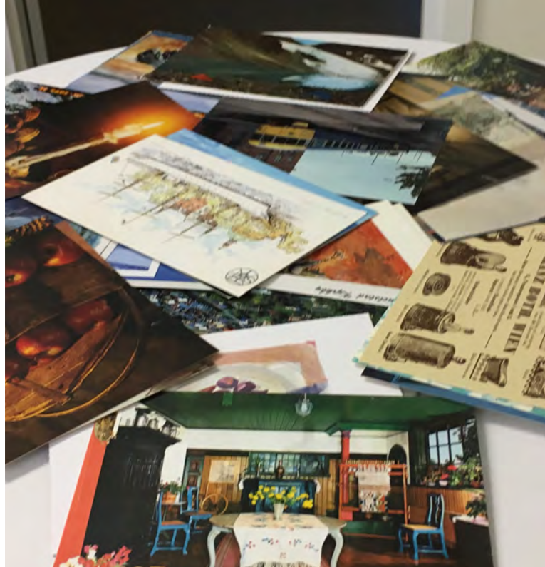
Övningarna är utarbetade i Luleå kommun.